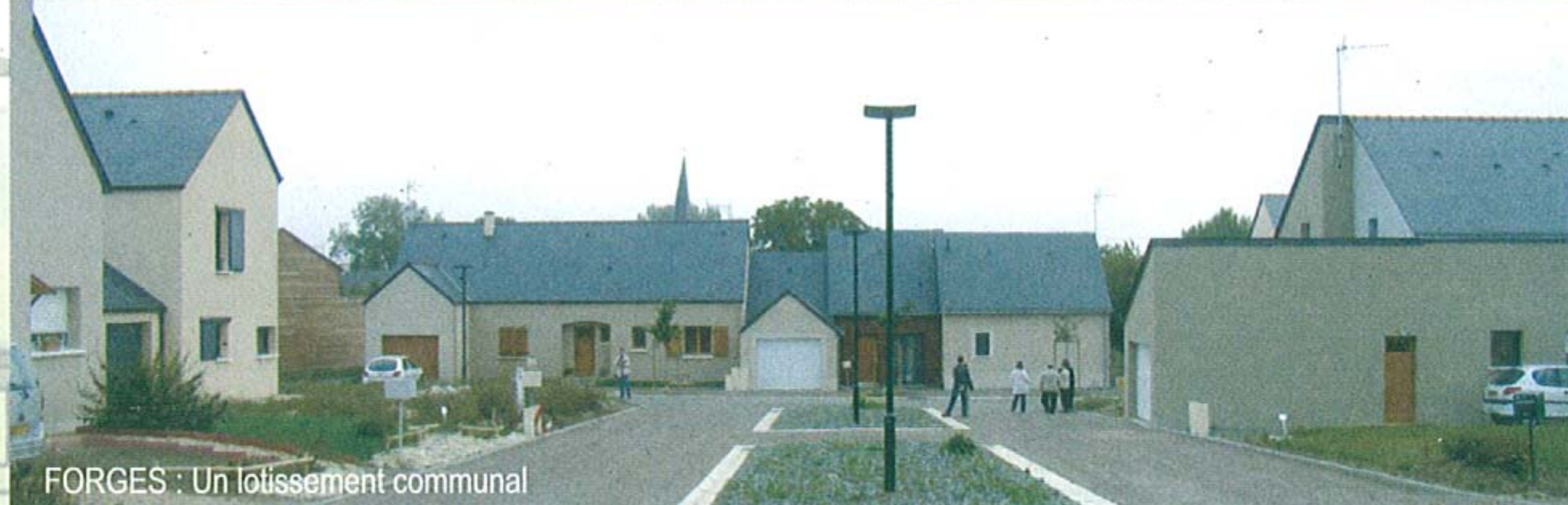
FORGES : Un lotissement communal