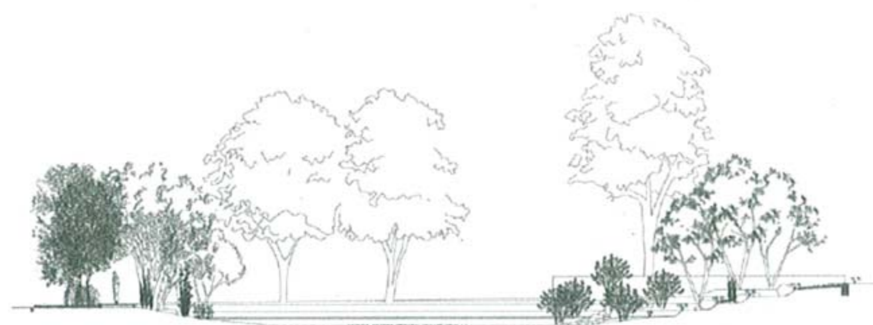
Coupe transversale sur l'étang