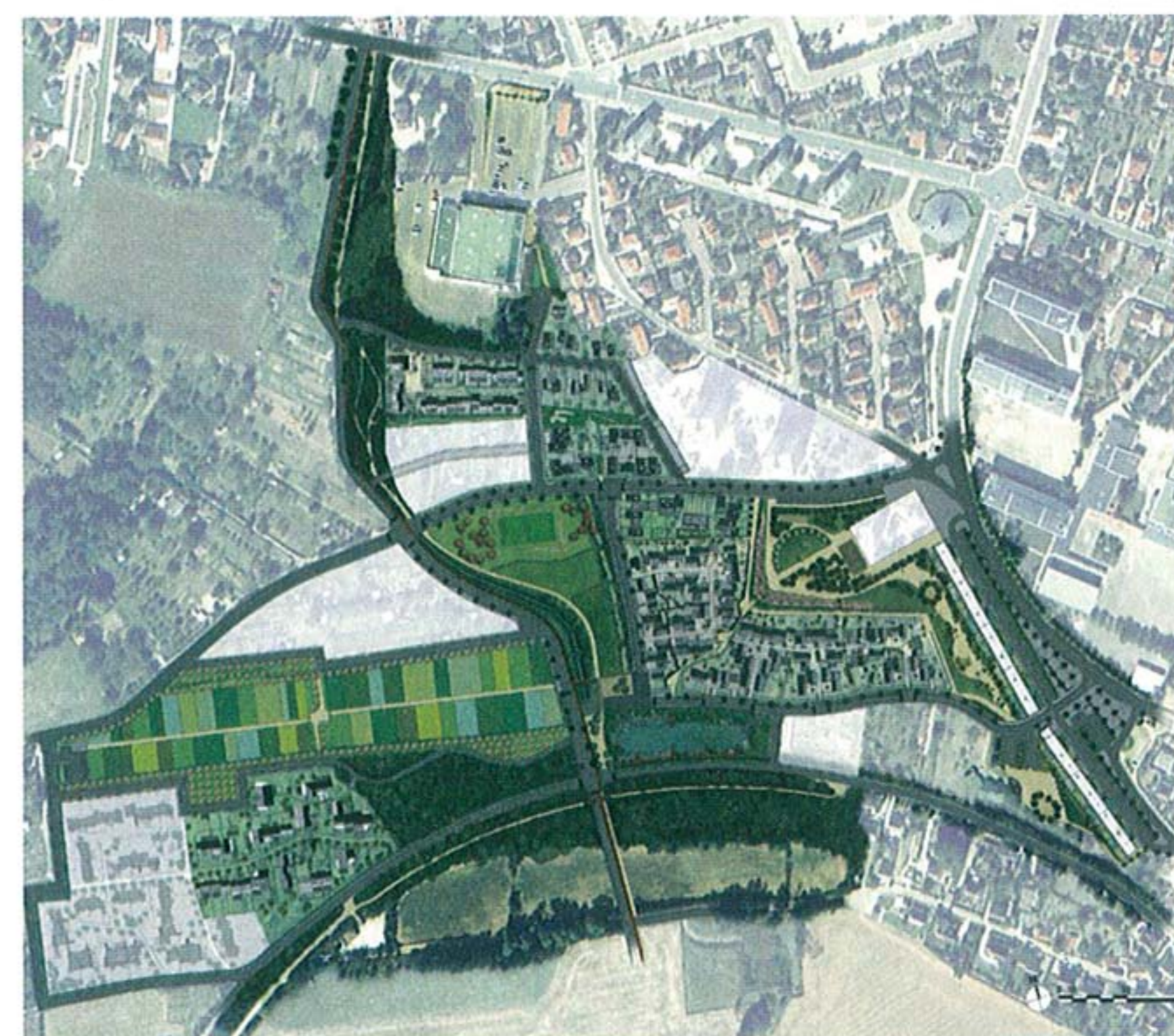
Plan masse du quartier des Brichères