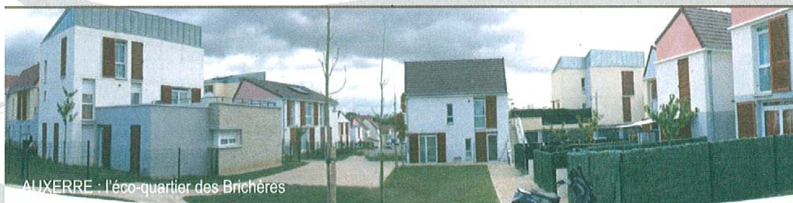
AUXERRE : l'éco-quartier des Brichères