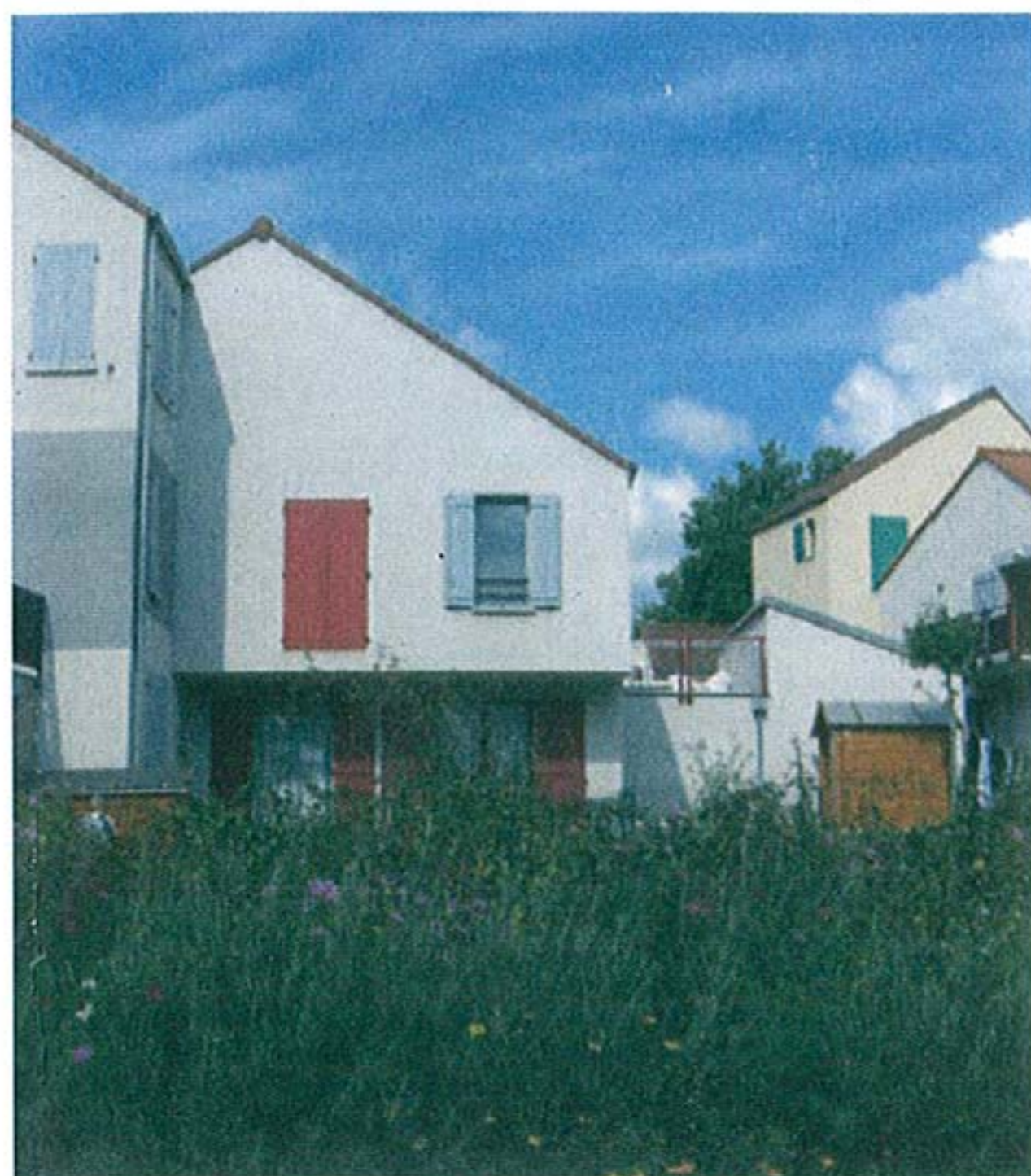
Logements locatifs intermédiaires - architecte Lucien Kroll