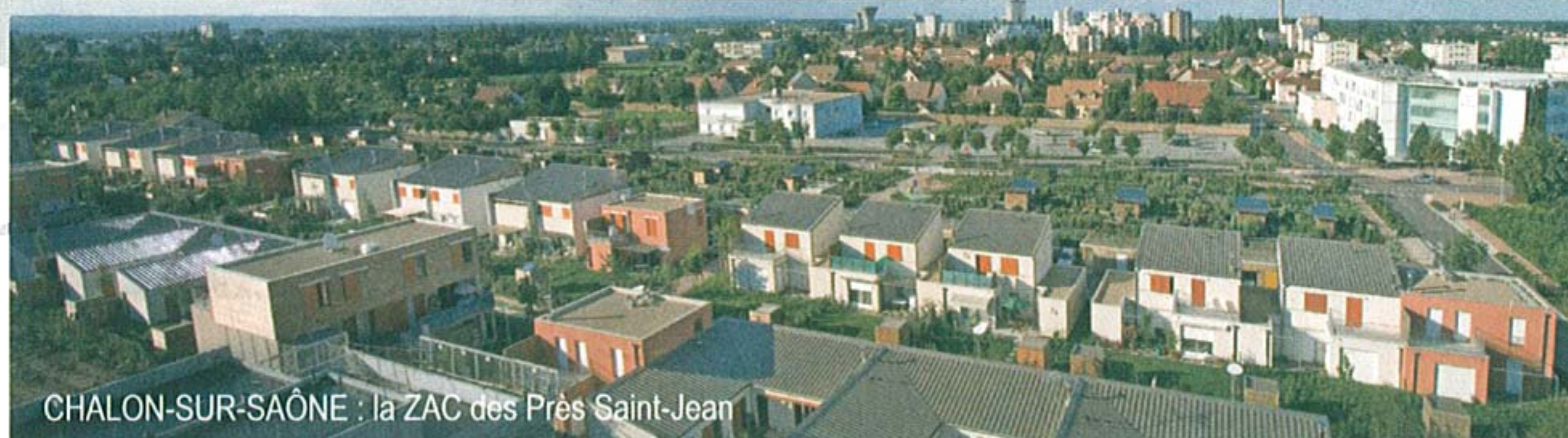
CHALON-SUR-SAÔNE : la ZAC des Prés Saint-Jean